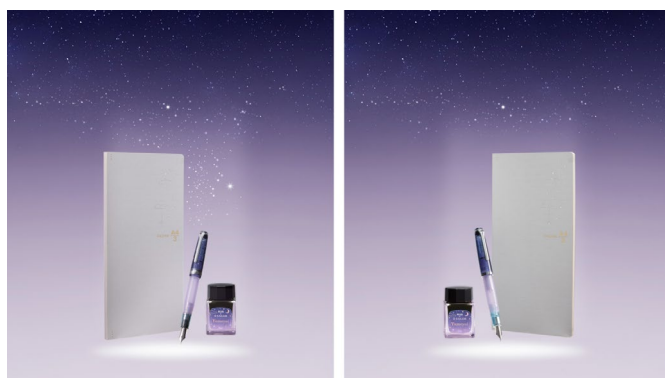
左：「カ.クリエ プレミアムクロス×プロフェッショナルギア スリム 夢宵限定セット」 右：「カ.クリエ プレミアムクロス×レクル 夢宵限定セット」

プラス株式会社（東京都港区 代表取締役社長 今泉忠久、以下プラス）と、セーラー万年筆株式会社（東京都港区 代表取締役社長 田村光、以下セーラー万年筆）は、“夢宵（ゆめよい）”をテーマにした万年筆とノート、ボトルインクをセットにした「カ.クリエ プレミアムクロス×万年筆 夢宵限定セット」を 2025 年 12 月 5 日に発売します。